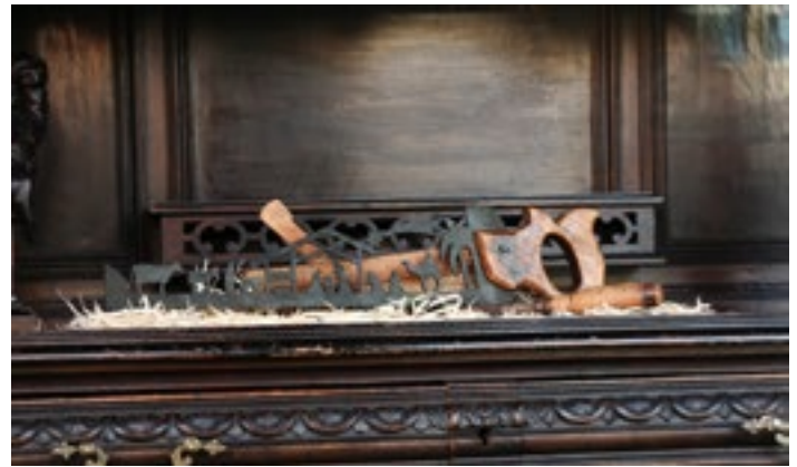
Fuchsschwanzkrippe von Stefan Reindl bei Schreinerei Kiener