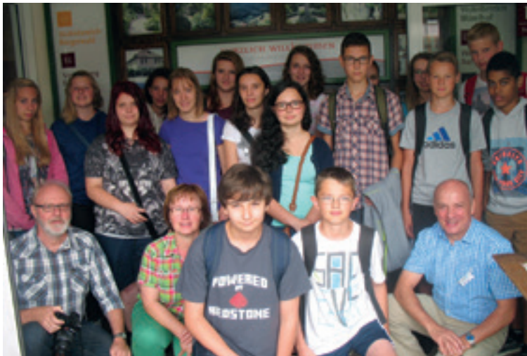
Hahnbacher Schülerinnen und Schüler informierten sich über die Ausbildungsangebote im Phönix Seniorenzentrum Evergreen.

Die Ausbildung hat für Seniorenheime und deren Qualität eine große Bedeutung. Nach Einschätzung des Heimleiters kann dem viel diskutierten Fachkräftemangel in der Pflege nur begegnet werden, wenn in die Ausbildung junger Menschen auch von Seiten der Heimbetreiber investiert wird.