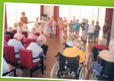
▲ Aktionstag Musik: Wir gaben im Seniorenheim „Evergreen“ ein Ständchen