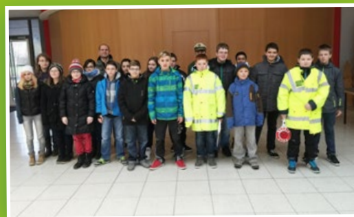
▲ Schülerlotsenausbildung: Ein Beitrag zur Verkehrssicherheit