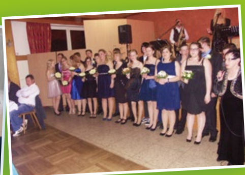
▲ Ein besonderer Abend für unsere Neuntklässler: Tanzkursabschlussball