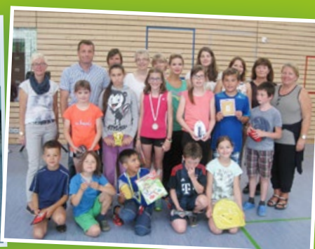
▲ Die besten Sportler der Bundesjugendspiele 2015