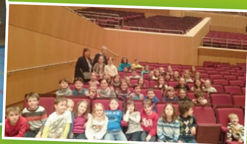
▲ Fahrt nach München zu „Der Gasteig brummt!“