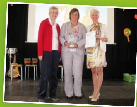
▲ Zertifizierungsfeier in Siegenburg: Nun dürfen wir uns offiziell „musikalische Grundschule“ nennen