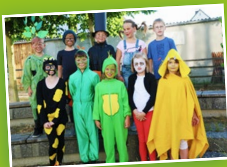
Musical „Tabaluga“: Der Höhepunkt des Schuljahres

Wir begrüßen 33 ABC-Schützen in unserer Schulfamilie