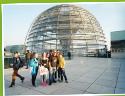
▲ Abschlussfahrt der 8. und 9. Klasse nach Berlin