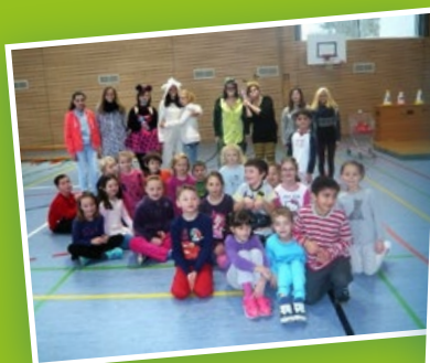
▲ Faschingsturnen in der Halle