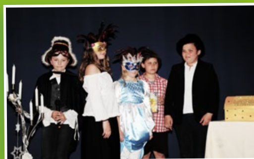
▲ Theateraufführung „Der Kaufmann von Schnaittenbach“