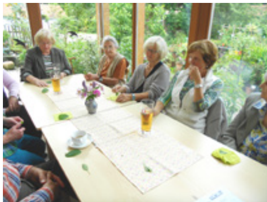
Fühlen, Riechen und Schmecken von Kräutern stand für pflegende Angehörige bei der Sitzführung der AOVE im Kräutergarten Schnaittenbach auf dem Programm.