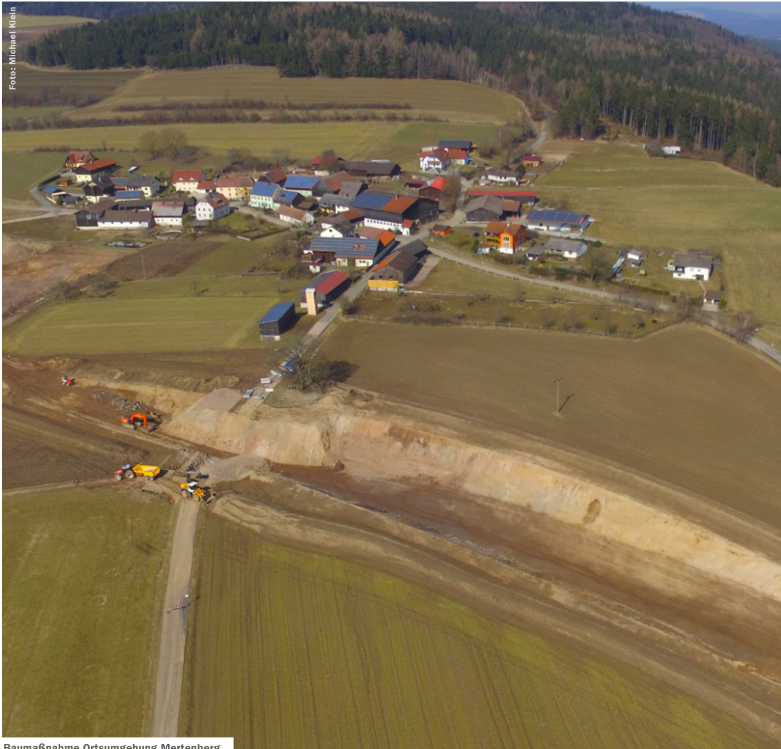
Baumaßnahme Ortsumgehung Mertenberg