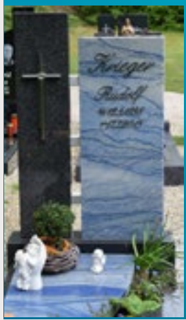
*Grabstein vor der Beisetzung entfernen, Nachbeschriften und nach der Ruhezeit wieder setzen am Friedhof

STERBEFALL EINER BESTEHENDEN GRABANLAGE FESTPREIS 1690,-€ INKL. MWST*