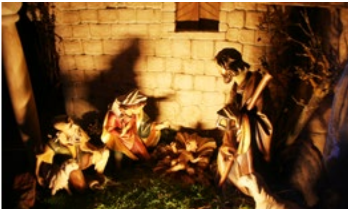
Ruinenkrippe im Feuerwehrhaus