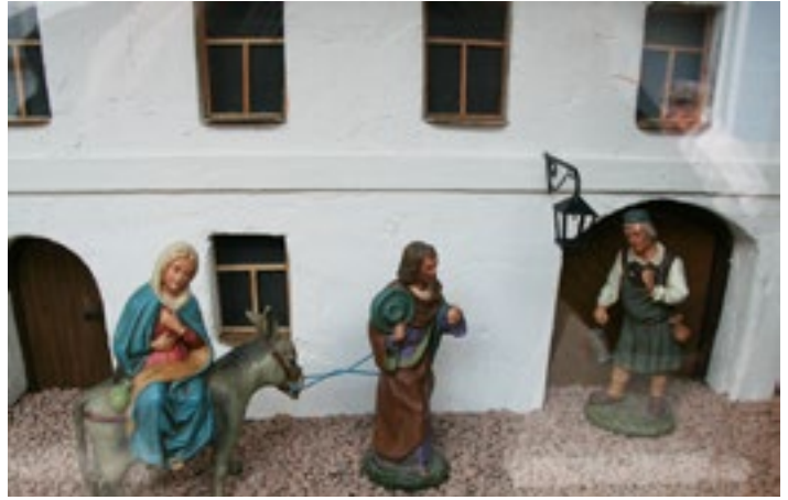
Herbergssuche von Sepp Mutzbauer im Wawerlhaus in der Blumenstraße