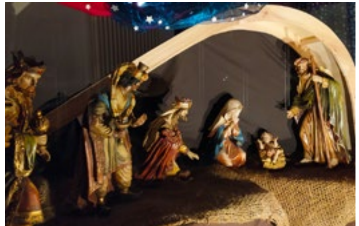
Orientalische Figuren im Vitusheim