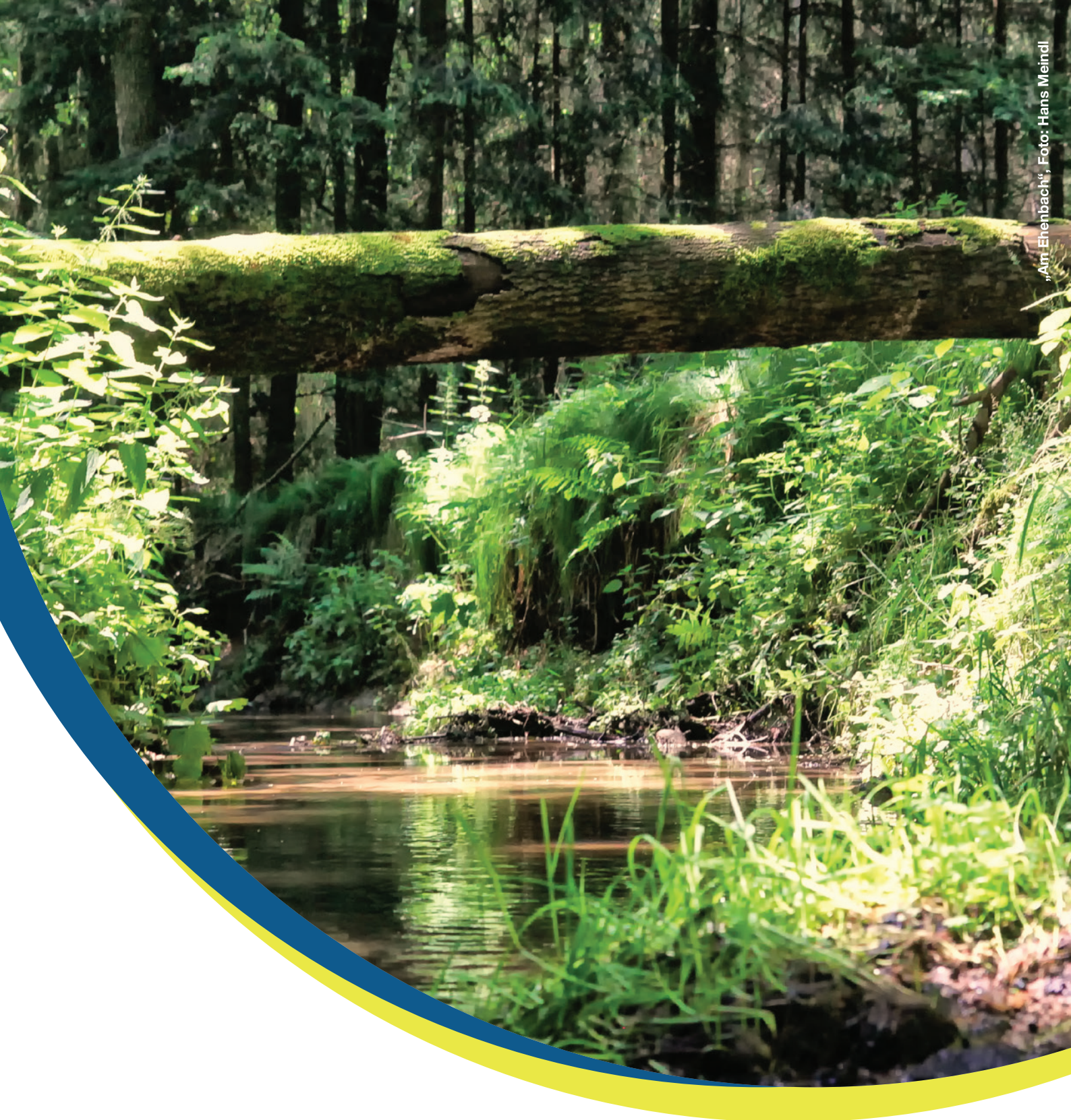
„Am Ehenbach“, Foto: Hans Meindl