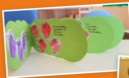
Selbst gebasteltes Bilderbuch

Ein einschneidendes Erlebnis war zu sehen, wie ein Schmetterling aus seinem Kokon schlüpfte. Neben dieser Attraktion werden fast täglich Lieder vom Schmetterling gesungen, Fingerspiele erlernt und fleißig gebastelt. Im Moment sind die Krippenkinder dabei, ihr eigenes „Raupe-Nimmersattbuch“ zu erstellen. Als Abschluss wird Ende Juli ein Nimmersattfest gefeiert. Aber bis es so weit ist, folgen noch weitere tolle Aktionen.