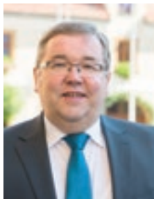
Schnaittenbach, im Dezember 2018

Liebe Mitbürgerinnen und Mitbürger, verehrte Leserinnen und Leser unseres „Schnaittenbach aktuell“,