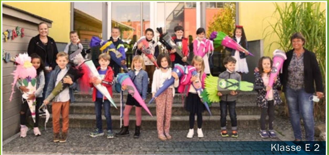
Klasse E 2