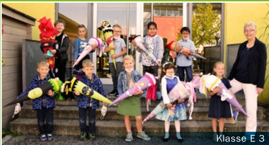
Klasse E 3