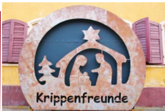
Die vereinseigene Freikrippe, das in Metall und Rostoptik ausgeführte Vereinslogo der Krippenfreunde, wird am Samstag, 20. November, wieder auf dem Marktplatz zwischen Kirche und Rathaus aufgestellt.