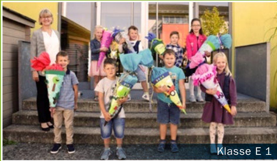
Klasse E 1